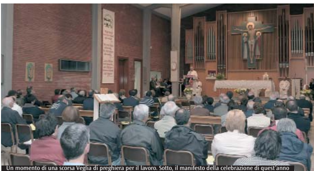
Un momento di una scorsa Veglia di preghiera per il lavoro. Sotto, il manifesto della celebrazione di quest'anno